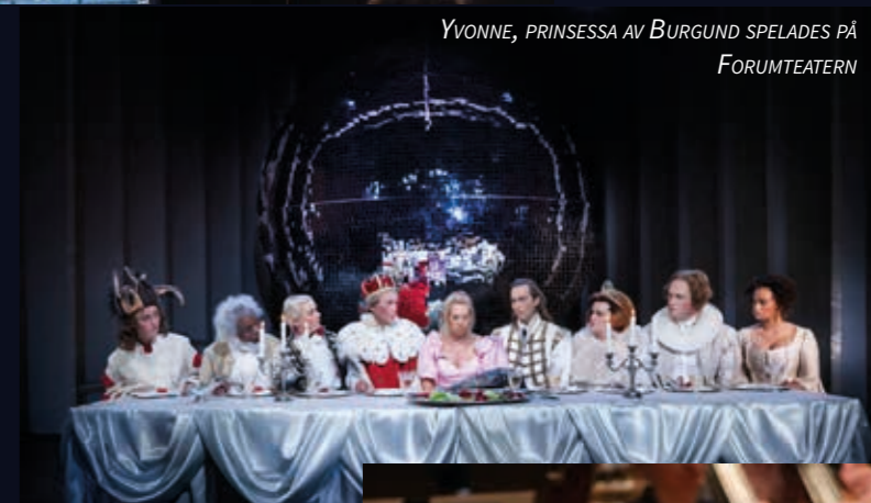
YVONNE, PRINCESSA AV BURGUND SPELADES PÅ FORUMTEATERN