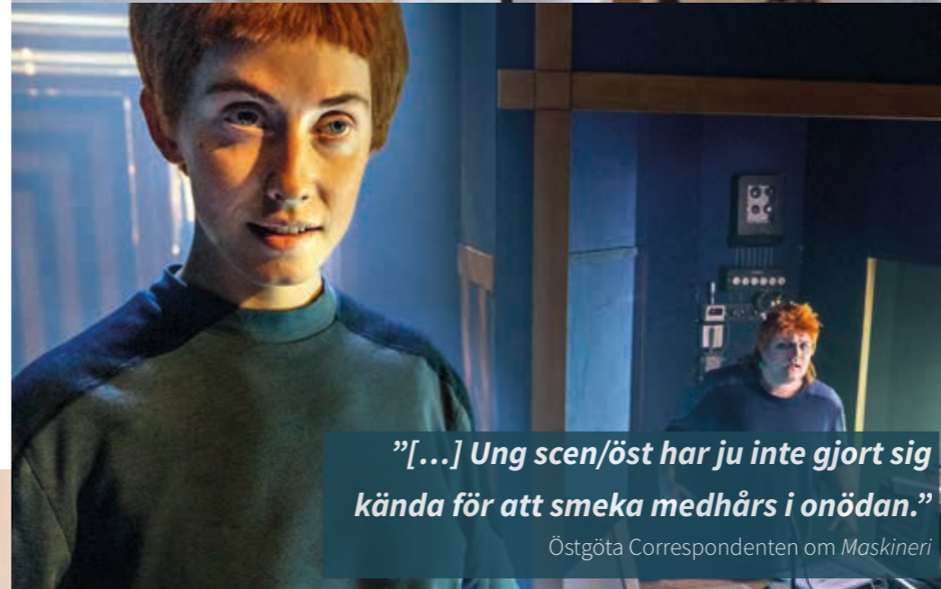
”[...] Ung scen/öst har ju inte gjort sig kända för att smeka medhårs i onödan.”