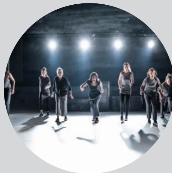
Bild från föreställningen Lupinerna från 2018. En föreställning om frihet och att ensam inte är stark.