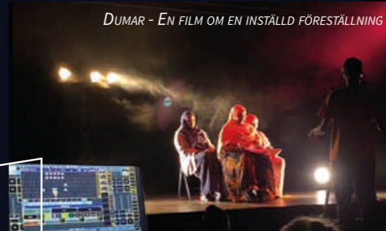
DUMAR - EN FILM OM EN INSTÄLLD FÖRESTÄLLNING