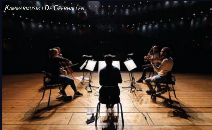
KAMMARMUSIK I DE GEERHALLEN