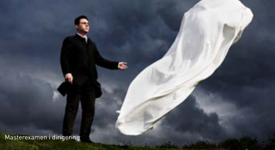
Masterexamen i dirigering