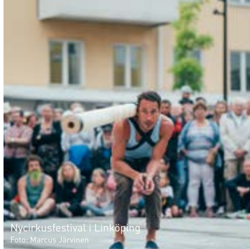
Nycirkusfestival i Linköping