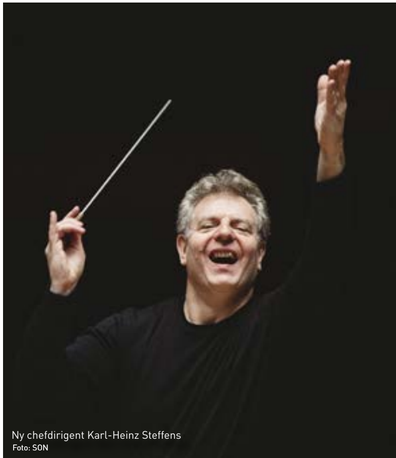
Ny chefsdirigent Karl-Heinz Steffens