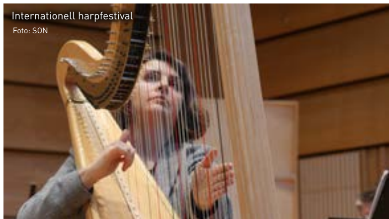
Internationell harpfestival