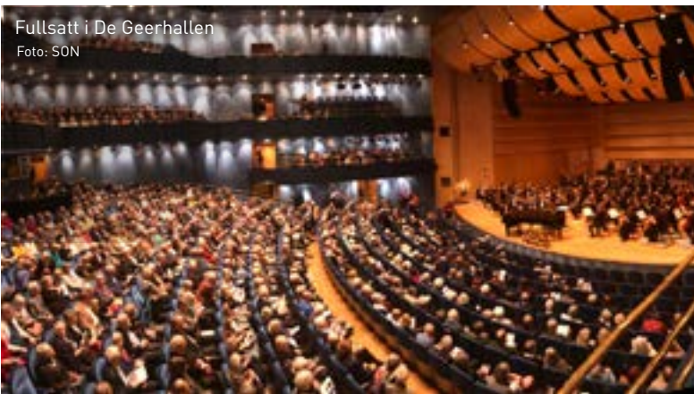
Fyllsatt i De Geerhallen