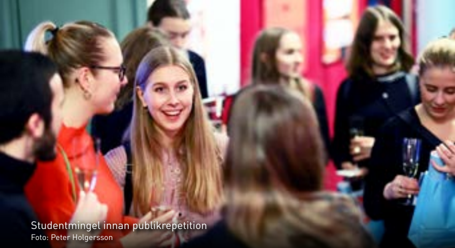
Studentmingel innan publikrepetition