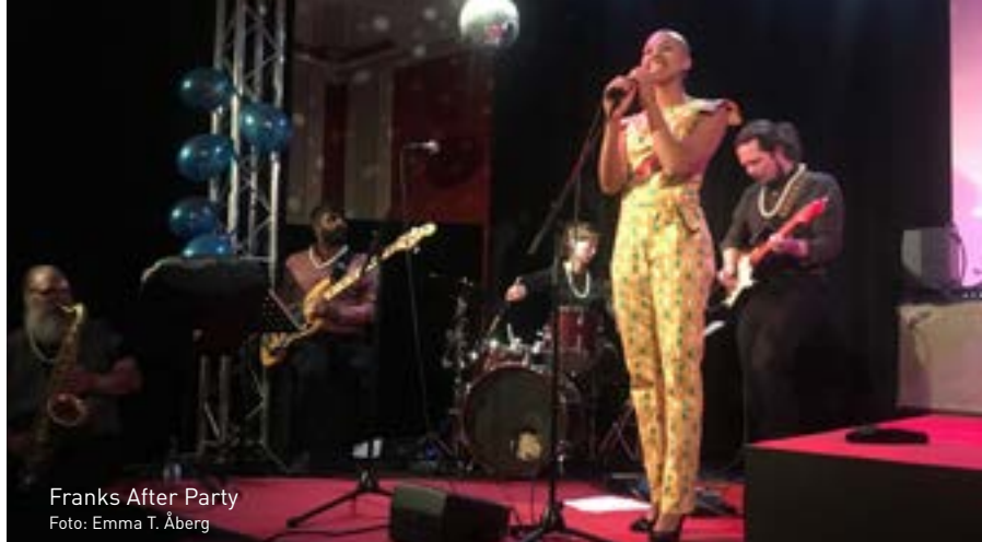
Franks After Party