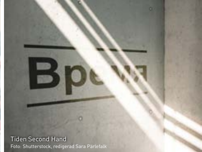
Tiden Second Hand Foto: Shutterstock, redigerad Sara Pärtefalk