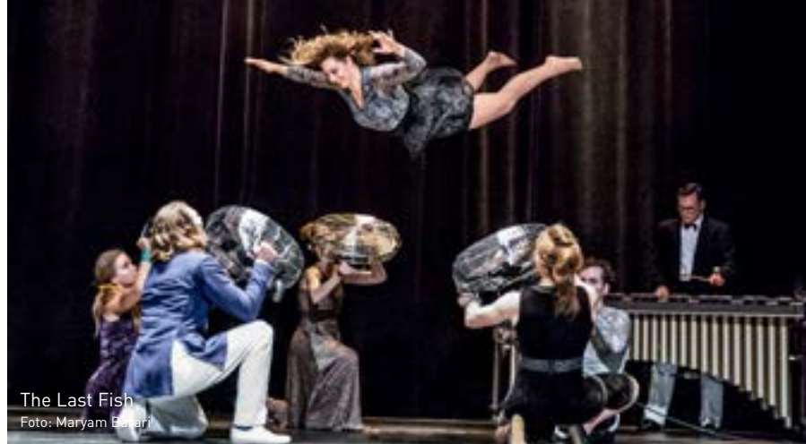
The Last Fish