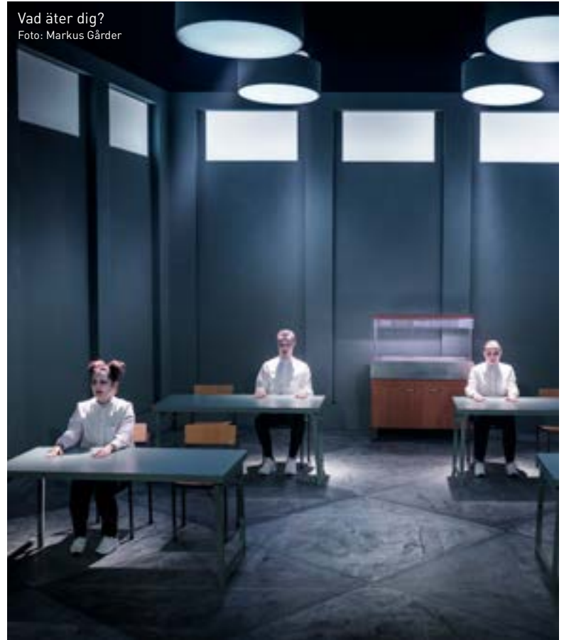
Vad äter dig?