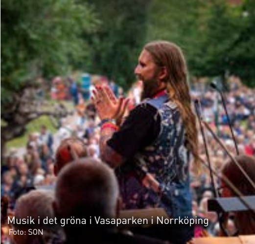
Musik i det gröna i Vasaparken i Norrköping