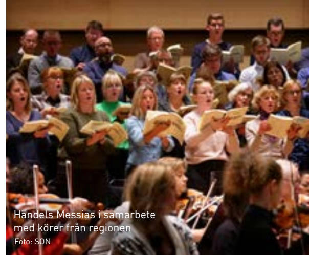
Händels Messias i samarbete med körer från regionen